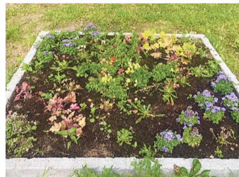
Посадка цветов в бетонную песочницу