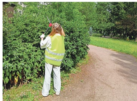
Санитарная обрезка кустарников