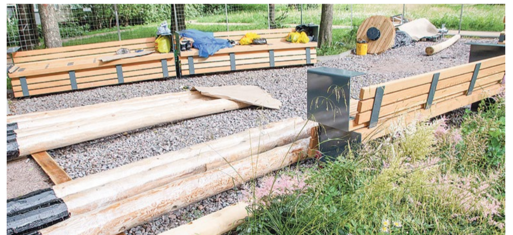
Строительные работы займут несколько недель