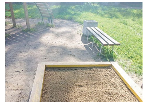
Замена песка в песочницах