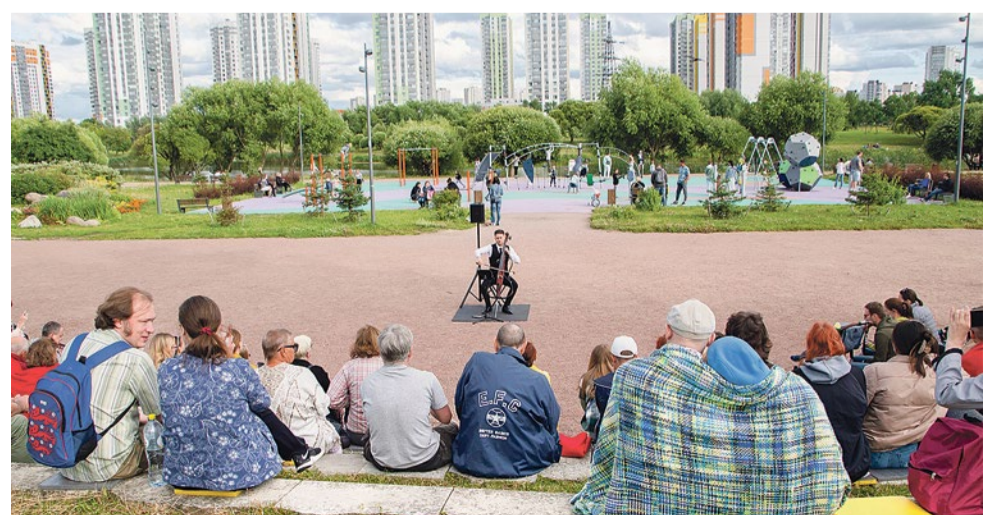
Филармония под куполом неба в парке Интернационалистов