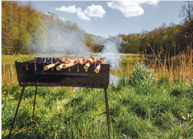
Убирайте за собой — не оставляйте одноразовые мангал и шампуры

Если в походе вы предпочитаете согреться чаем, возьмите листовой. Чайные пакетики содержат пластик, поэтому их нельзя просто выкинуть, а нести с собой неудобно.