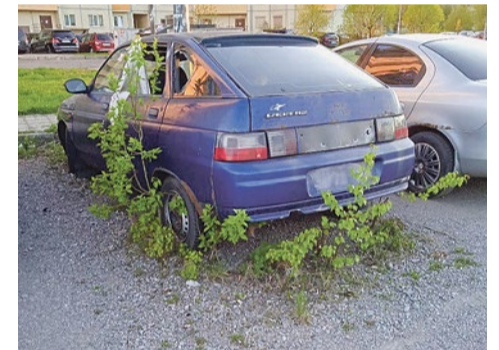
Вывоз разукомплектованных автомобилей