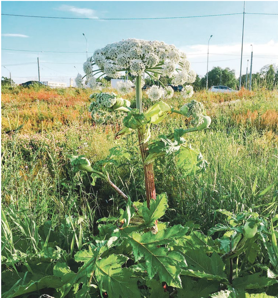
Борщевик Сосновского — ядовитый представитель семейства зонтичных