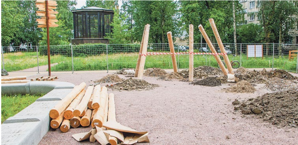
Установка игрового комплекса с горкой

Для правильного умственного и физического развития ребенку необходимо много двигаться и активно проводить досуг. Лучшее место для этого – детская площадка. На Бухарестской улице, 86, уже приступили к строительству детской игровой площадки в природном стиле.