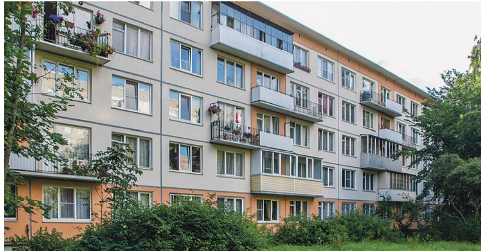
Хрущевка серии 1Лг-502, 1966 года постройки, Бухарестская улица, 94/3

– Критерием включения в программу не аварийных зданий является «строительство многоквартирных домов в период индустриального домостроения 1957–1970 годов по типовым проектам, разработанным в указанный период времени (типа «хрущевки» панельные)» – (ст. 2 Закона СПб). То есть под действие закона попадает вся типовая застройка указанного периода, включая даже девятиэтажные панельки. Правда, вице-губернатор Николай Линченко читает это определение иначе – только панельные хрущевки (ред. муниципалитет обратился за разъяснением к губернатору). Можно предположить, что более всего уязвимы пятиэтажные дома серии ГИ, те, что без балконов и с двумя квартирами на этаже – их расселение обойдется застройщику дешевле всего. Но ему может пригнаться и другой квартал, а город пойдет навстречу. Ведь ветхость зданий